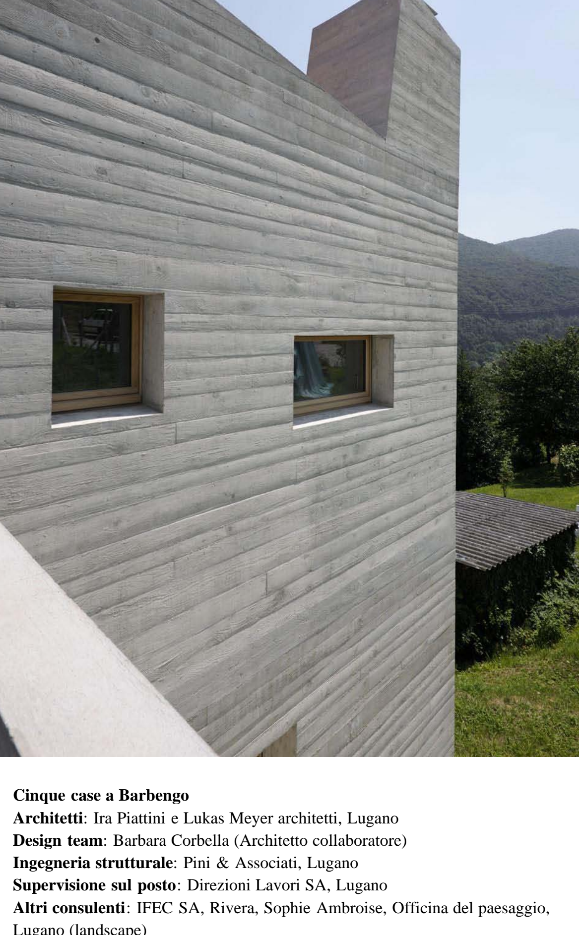
← Studio Meyer Piattini, 5 case a Barbengo, Lugano, Svizzera 2011

Per l'interno, il legno è impiegato per pavimenti, serramenti e soletta inclinata di copertura, eseguita con dei cassettoni di legno portanti della Lignatur e lasciata a vista. Il cemento del pavimento al piano terra prosegue poi in modo unitario nelle pavimentazioni esterne. Qui i terrazzamenti sono stati piantati di nuovo a vigna e restituiti in questo modo al territorio. Le cinque case sono a basso consumo energetico (Minergie) e sono munite di una termopompa per il riscaldamento, che può essere accoppiata a pannelli solari per la produzione dell'acqua calda.