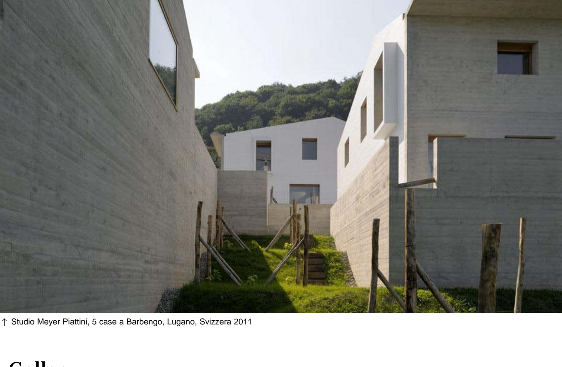
↑ Studio Meyer Piattini, 5 case a Barbengo, Lugano, Svizzera 2011