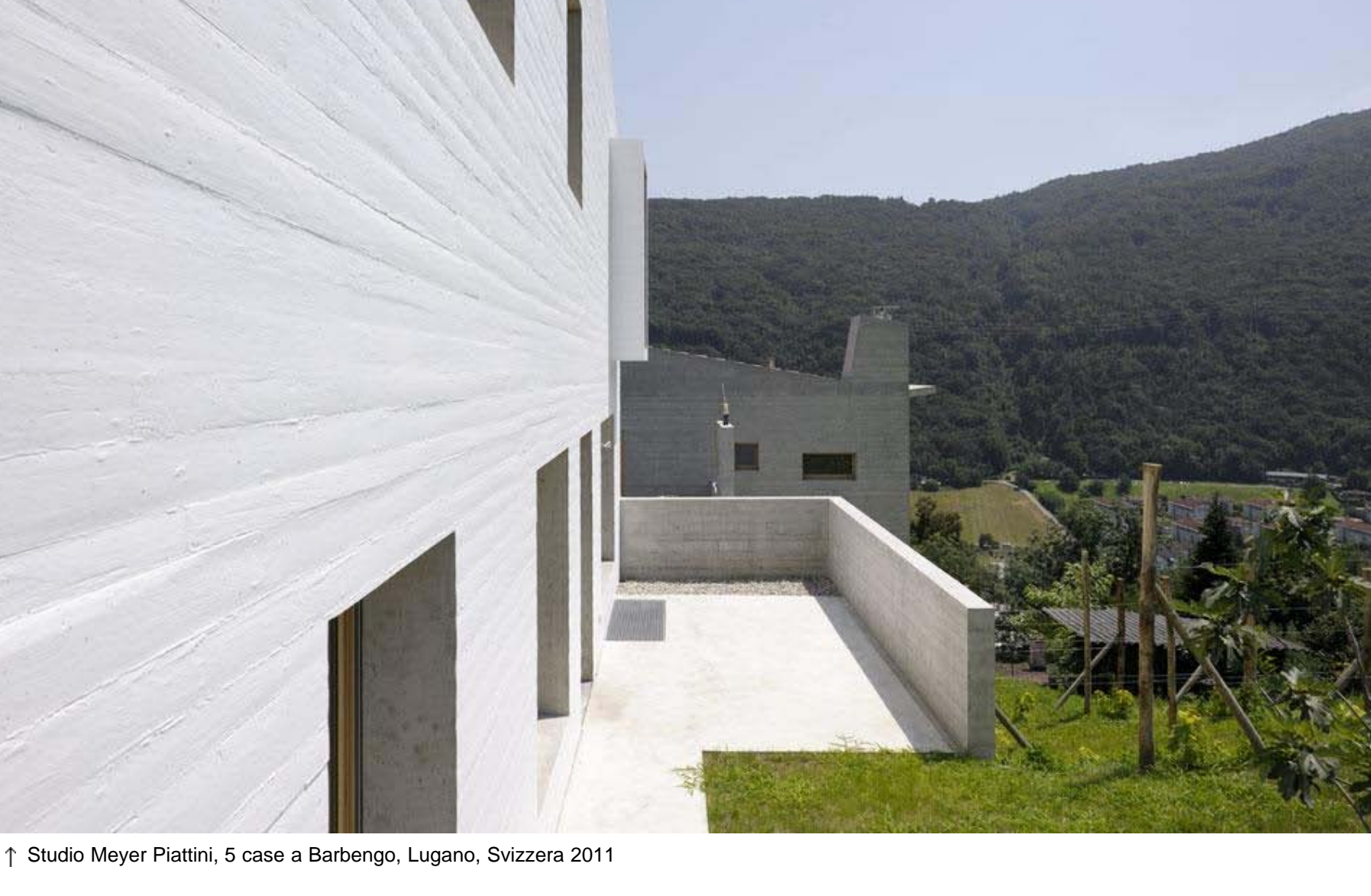
↑ Studio Meyer Piattini, 5 case a Barbengo, Lugano, Svizzera 2011

Per l'interno, il legno è impiegato per pavimenti, serramenti e soletta inclinata di copertura, eseguita con dei cassettoni di legno portanti della Lignatur e lasciata a vista. Il cemento del pavimento al piano terra prosegue poi in modo unitario nelle pavimentazioni esterne. Qui i terrazzamenti sono stati piantati di nuovo a vigna e restituiti in questo modo al territorio. Le cinque case sono a basso consumo energetico (Minergie) e sono munite di una termopompa per il riscaldamento, che può essere accoppiata a pannelli solari per la produzione dell'acqua calda.