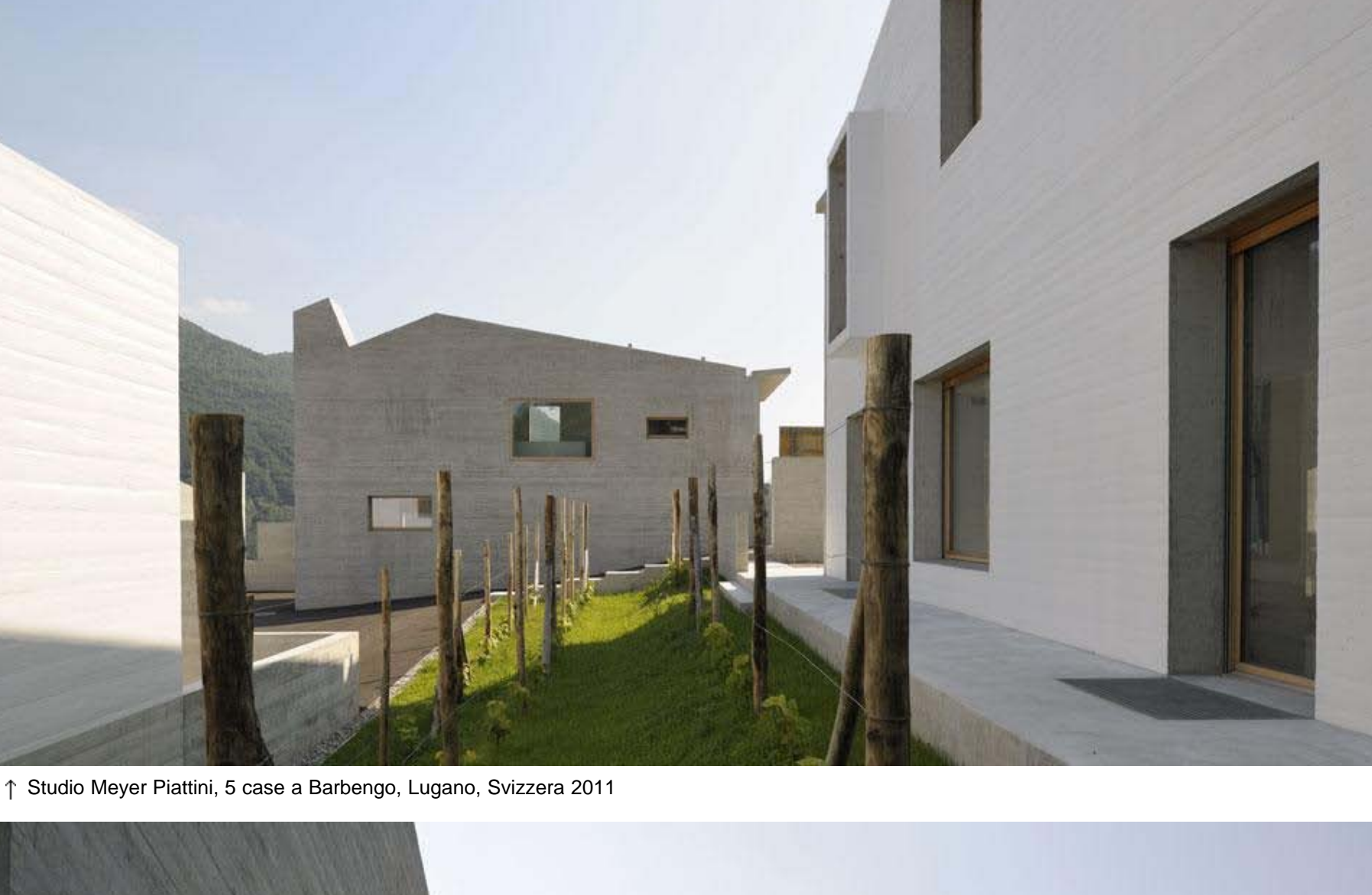
↑ Studio Meyer Piattini, 5 case a Barbengo, Lugano, Svizzera 2011