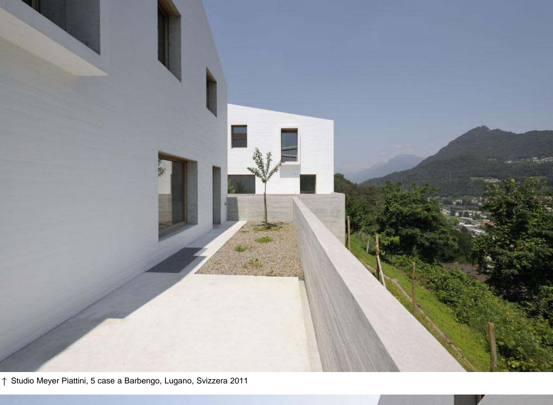
↑ Studio Meyer Piattini, 5 case a Barbengo, Lugano, Svizzera 2011